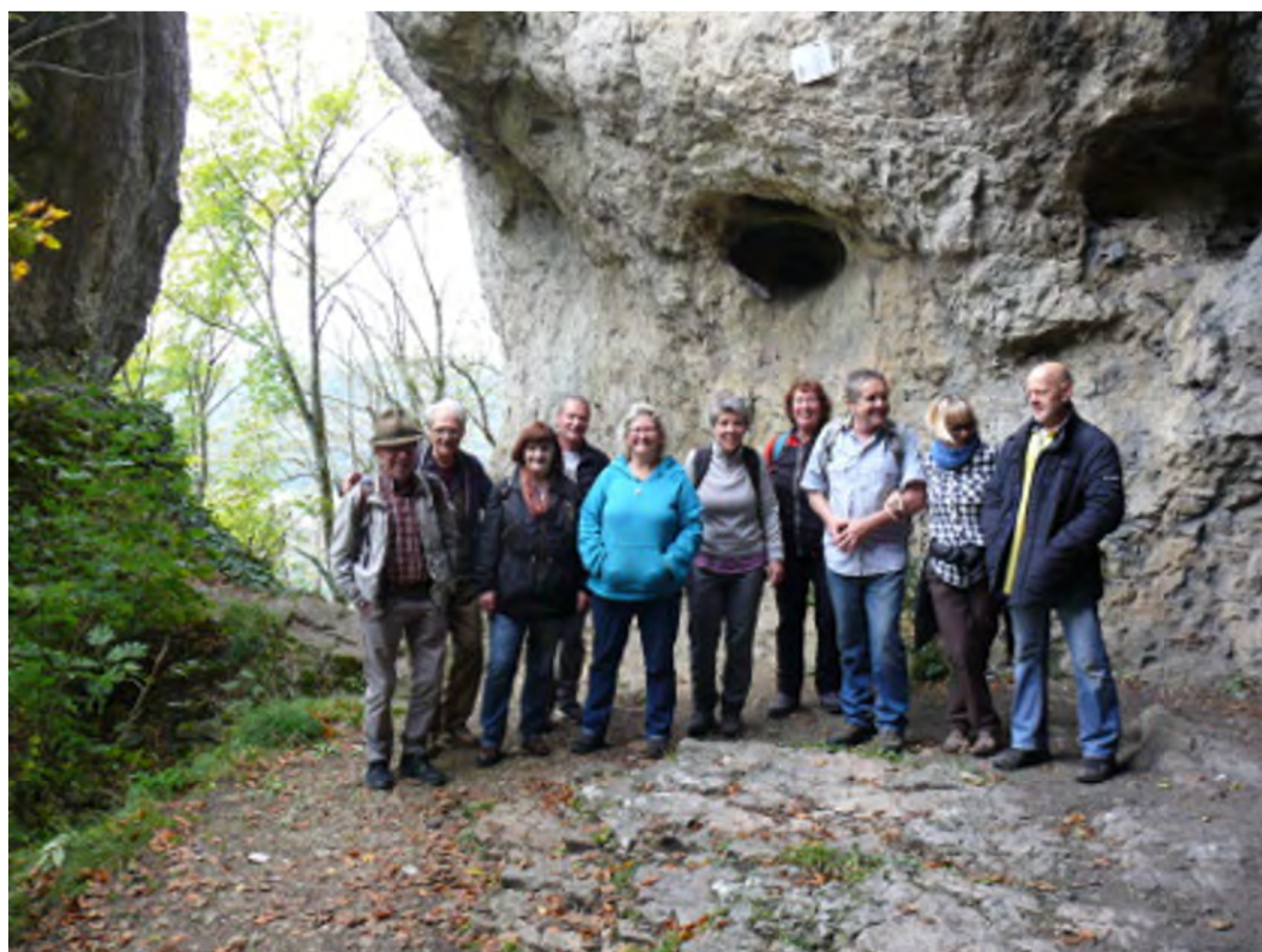
Die Gruppe beim „Hohlen Felsen“

Am nächsten Vormittag besuchten wir die nahe gelegene „König-Otto-Tropfsteinhöhle“ Eine sehr große und schöne Topfsteinhöhle. Dort aßen wir auch zu Mittag. Zurück im Jugendhaus hatten wir dann noch Kaffee und Kuchen, bevor wir uns mit vielen Eindrücken auf den Rückweg machten.